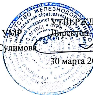
График государственной итоговой аттестации обучающихся группы П-4-478 очной формы обучения специальности 08.02.10 Строительство железных дорог, путь и путевое хозяйство в форме государственного экзамена